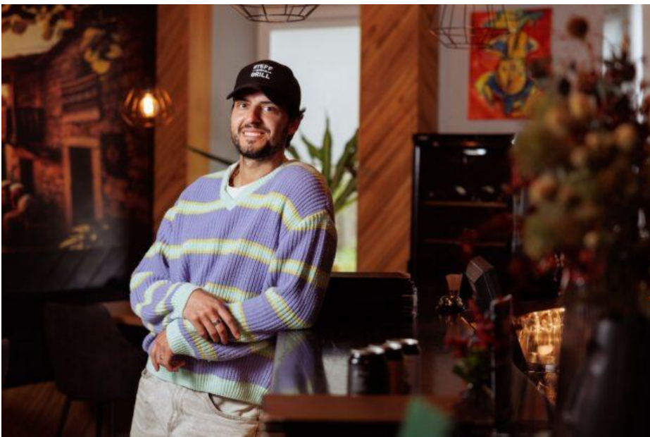
Kuvat Stanislav Moshkov, Susanna Poikela

Teksti Susanna Poikela, Kuvat Stanislav Moshkov, Susanna Poikela (10.7.25) Tekstiä on muokattu. (lähde: https://balticguide.ee/stefan-elamaa-musiikin-ja-hellan-valissa/ )